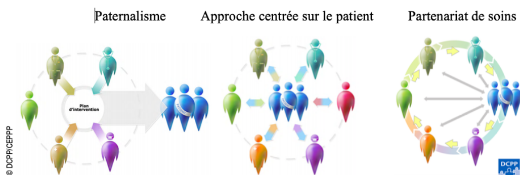
Figure 1 : Représentation de trois approches concurrentes des soins et services de santé

Le partenariat de soins et de services (PSS) est une approche développée au cours des dernières années par la Direction collaboration et partenariat patient (DCPP) de l'Université de Montréal (UdeM). Ce partenariat est défini comme «une relation de coopération-collaboration entre le patient, ses proches et les intervenants de la santé et des services sociaux (cliniciens, gestionnaires ou autres) qui s'inscrit dans un processus dynamique d'interaction et d'apprentissage et qui favorise l'autodétermination du patient et l'atteinte de résultats de santé optimaux 38 ». Elle est l'approche enseignée dans le cadre de la formation initiale des programmes de santé et de services sociaux de l'UdeM. On l'oppose à l'approche paternaliste et à l'approche centrée sur le patient, qui ont longtemps prévalu et sont encore appliquées dans certains contextes (figure 1).